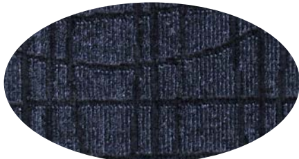
UBE-55 シルバー/ブラック